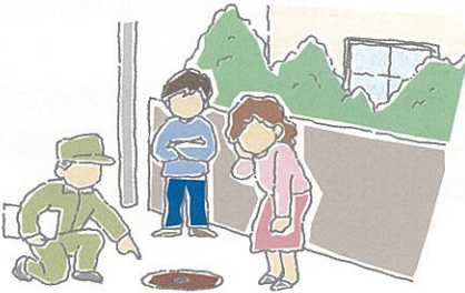
みなさんと町の仕事

ますの位置はご家庭などの水回りを考えて、みなさんと相談しながら、町が設置します。